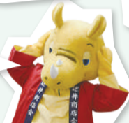
◀逆井商店会 キャラクター さかサイ君

「赤巻紙 青巻紙 黄巻紙」 「買った肩たたき高かった」 「密集阻止 密集阻止 密集阻止」