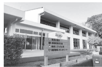
▲新センターの外観

☎感染症の拡大防止のため休止している施設やサービスなど、詳しくは市のホームページをご確認ください