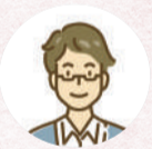
市内在住・40歳代男性

柏市にパートナーシップ制度ができたことで、お互いを「家族」として届け出をした証明があるというのは、とてもありがたいです。