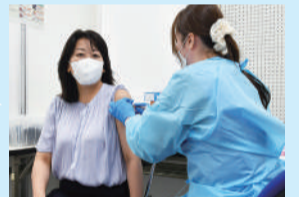
▲夜間接種を利用して接種を受ける 太田市長

イトーヨーカドー柏店の会場では、夜間の予約枠を設けています。仕事や学校で昼間に接種を受けられないかたは、この機会にご利用ください