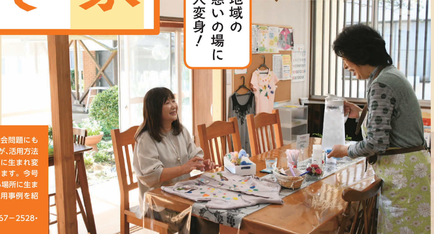
取材先:居どころカフェ手しごと倶楽部

全国的に増え続け社会問題にもなっている空き家ですが、活用方法によって魅力的な場所に生まれ変わる可能性を秘めています。今号では、地域で親しまれる場所に生まれ変わった空き家の活用事例を紹介します。