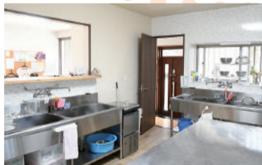
▲大人気で調理がしやすいように改修した台所

居どころカフェを始めた頃は喫茶店の運営方法など何も分からず、手伝いに来てくれたかたと接客を練習し、マニュアルを作ることから始めました。開店して半年ほどたちますが、地域のかたが、私の苦手なパソコン操作を教えてくれたり、チラシ作りを手伝ってくれたりして毎日が文化祭のようです。店員とお客さんという関係ではなく、地域のかたがたと一緒にいろいろなことを楽しめるような居どころを作っていきたいです。