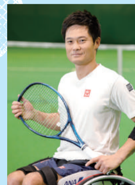
▲世界で活躍する国枝慎吾選手

問 11月15日(火)までに、往復はがきに催し名・住所・氏名(ふりがな)・年齢・電話番号を書いて、〒277-0005柏1丁目7-1-301 柏市国際交流センターへ郵送(必着)か ☎koen-1@kira-kira.jp で※応募者多数の場合は抽選。結果は11月25日(金)までに通知。車いすのかたは申込時に記入を