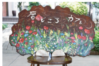
▲地域のかたが作成してくれた看板

柏市社会福祉協議会の支え合い活動に参加した時に、空き家の改修に市の補助金を使えることを知りました。費用への不安を払拭することで一歩踏み出すことができ、補助金の申請も市の職員さんが相談に乗ってくれて何とか行うことができました。