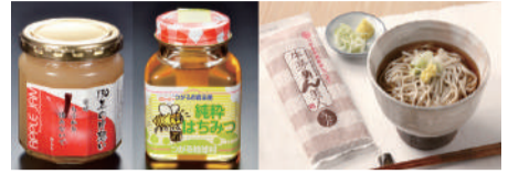
▲特産品のりんごジャムやほちみつ、ゴボウ麺

☎ 期間中に金融機関等で申し込むと自動的に抽選対象 ▶ 申込日現在、未納があるかたは対象外 ▶ 当選者には来年3月下旬までに通知