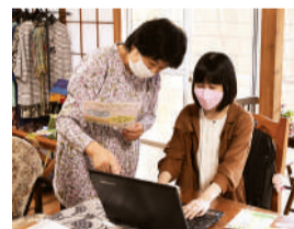
▲一緒にカフェのチラシ作り

年の離れたかたも利用していて初めは緊張しましたが、何度か通っているうちに自然と会話が弾むようになっていました。私がボランティアでカフェの案内チラシを作成していると、他の利用者さんがいろいろな意見を出してくれるんです。ここで過ごす時間は新鮮で、アルバイトよりも楽しいです。