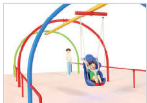
▲設置遊具のイメージ