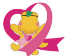
Kashiwani©KIC2009 ピンクリボン×カシワニ

乳がんは日本人女性がかかるがんの中で第1位です。市では、30歳以上の女性を対象に乳がん検診を行っているため、早期発見のために検診を受けてみませんか。