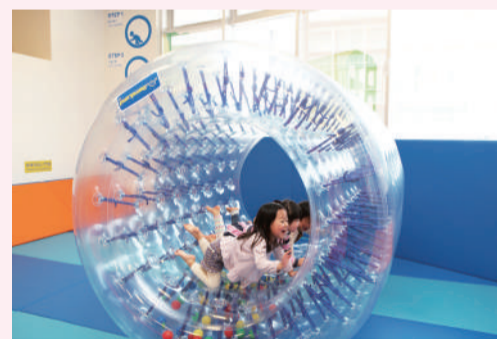
▲ボーネルンド社の遊び道具

柏の子どもたちが伸び伸びと成長するためには、保護者、保育士や先生だけでなく、行政や企業、地域など、子どもに関わる全ての立場の人が、子