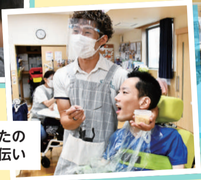
障害があるかたの「食事」をお手伝い