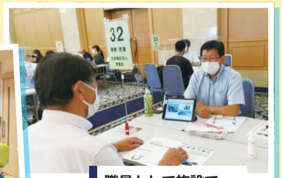
職員として施設で働く人材を募集・採用