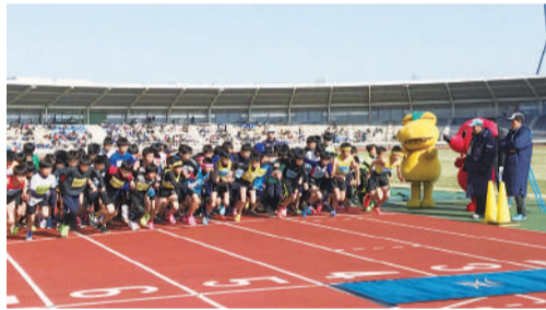
▲前回は約2,000人が参加