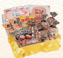
商品提供元/伊藤ハム

伊藤ハムの主たる工場として設立五十余年の柏にある東京工場で作った6種類のハムなどのセット