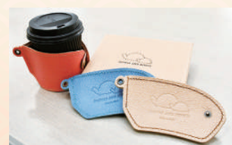
商品提供元/Next-Creation 多機能型事業所 l'lbe(アイビー)