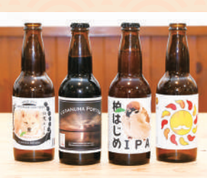
商品提供元/こまいぬブルワリー

ビアソムリエの醸造長がこだわった厳選素材を使い、ビールのイメージを覆す驚くほど多彩な味わいが魅力の「柏麦酒」