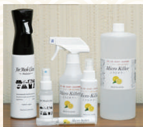
商品提供元/アクティブ・21

高い抗菌作用を100%天然由来成分で実現したミクロキラーと、空間消臭除菌剤エアメッシュクリーンの詰め合わせ