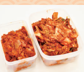
商品提供元/ワタマン

アミエビ・カキ・ホタテのうま味がぎゅっと詰まった手作り無添加のキムチとチャンジャのセット