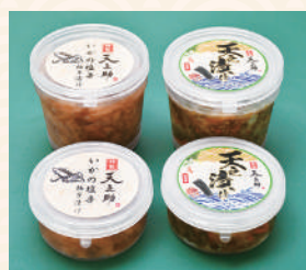
商品提供元/フーサー

市内の天ぷら屋「天之助」で人気のゆず香る塩辛と、細切りのイカ・昆布・たくあんがたっぷり入った松前漬けの詰め合わせ