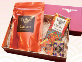
商品提供元/TribalCacao(トライバルカカオ)

厳選したカカオ豆と砂糖だけで作り、カカオそのものの味を生かした本格チョコレートの詰め合わせ