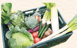
商品提供元/さかい

カブ、ネギ、ホウレンソウなど、公設市場に朝入荷されたばかりの採れたて新鮮野菜のセット