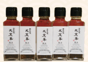
商品提供元/文菜華(ぶんさいか)

市内で育てた唐辛子と四川山椒(さんしょう)だけで仕上げた、突き抜けるような心地よい辛さが特徴のラー油