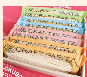
商品提供元/ニューオークボ

小麦本来の香りが楽しめる、生パスタのようなモチモチ食感のパスタ4種類の詰め合わせ