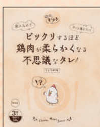
商品提供元/キュービックプランニング

無添加にこだわった、調理する直前に絡めるだけでふっくらジューシーに焼き上がるニンニクしょうゆ味の調味料