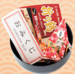
商品提供元/障害者就労支援ネットワーク P&P