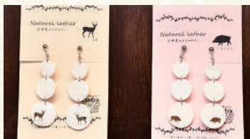
商品提供元/手作り科学館 Exedra(エクセドラ)

県内で駆除されたシカとイノシシの革を使い、丈夫さとしなやかさを兼ね備えたレザーアクセサリー