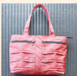
商品提供元/大洲商店

老舗畳屋と市内在住の作家との制作協力から生まれた、軽さと丈夫さが特徴の畳の縁(へり)を使ったバッグ