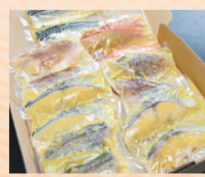
商品提供元/八代(やしる)

独自ブレンドの味噌にじっくりと漬け込み、うま味を凝縮させたキンメダイなど7種類の詰め合わせ