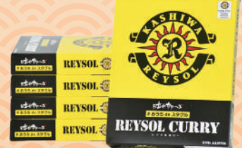
商品提供元/かまや商事