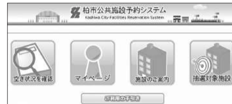
▲新システムのトップページ

◎新システムの操作方法については、柏市公共施設予約システムコールセンター(☎050-3311-9920)へ問い合わせを