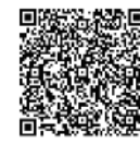
▲市のホームページはこちら