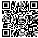
▲市のホームページはこちら