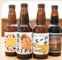
商品提供元/こまいぬブルワリー

M 柏ビール詰め合わせ ... 3人 地域密着にこだわり、小麦やホップまで全て柏産の材料を使った真正銘の「柏麦酒」