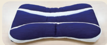
商品提供元/まくら

J まくら(蓑)がつくった枕 ... 3人 優しい肌触りと安定した寝心地を追求して作られた枕