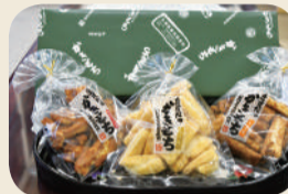
商品提供元/アグリサポートシステム

K ますだのかきもち詰め合わせ ... 5人 昔懐かしい素朴な味で食べだしたら止まらない、3種類(塩・しょうゆ・唐辛子)のかき餅セット