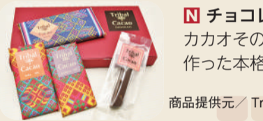
商品提供元/TribalCacao(トライバルカカオ)

柏市の三大野菜「カブ」「ネギ」「ほうれん草」の風味を生かしたオリジナルスイーツなど