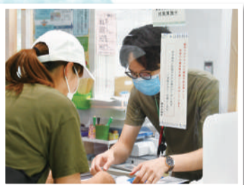
▲市役所の窓口ではビニールを掛けて対応

1月 31日 武漢市(中国)からの帰国者約30人を受け入れ 医師・保健師・看護師等が市内施設で対応にあたる