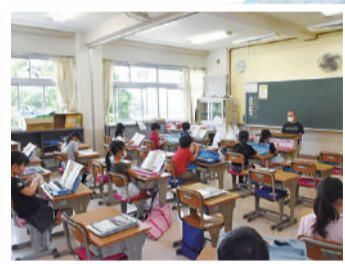
▲分散登校のため少人数での授業

18日 PCR検査の実施数が 1,500件を超える 市内では、5月3日以降 新規感染者0人を継続 (6月23日時点)