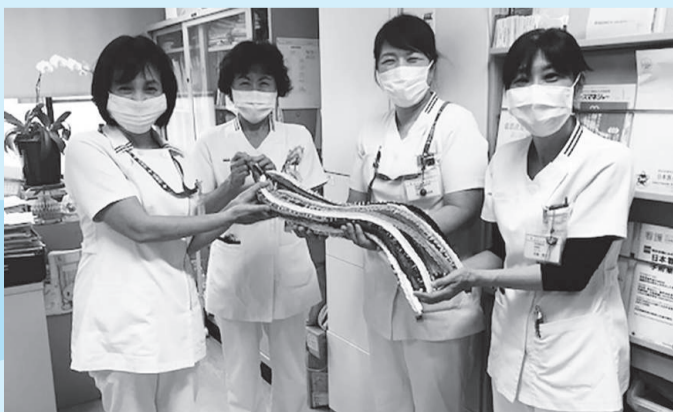
▲市内の中学生から届けられた千羽鶴に「元気をもらいました!」と喜ぶ医療関係者のみなさん