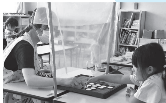
▲対面しての遊びはビニール越しで