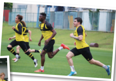
▲試合に備え、選手は日々トレーニング

6月1日からチームとしての練習が再開されました。人数や練習場所の制限、検温の実施など、引き続き感染対策をしながら、リーグ再開に向けて体も心も仕上げてきています。