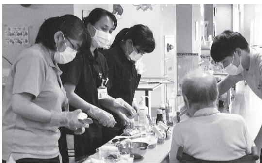
▲利用者さんの楽しみ「アイスクリーム会」

2月から面会を休止していますが、家族に会えないのは寂しいという声もあり、現在はテレビ電話での面会を行っています。ご家族やボランティアさんが参加する催しも休止しているので、それに代わる催しを企画して、利用者さんに施設内で楽しんでいただけるように努めています。外からウイルスを持ち込まないことを徹底した結果、利用者さんは風邪をひくこともほとんどなく、穏やかに過ごされています。