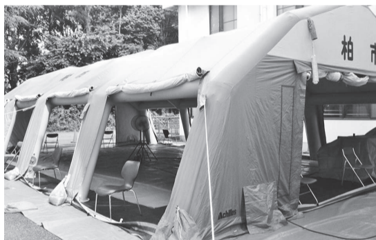
▲発熱患者の待合所として設置したテント

患者さんとスタッフの安全を守るため、既存の施設をどのように整えたらよいか職員同士で知恵を出し合い、発熱されたかたとその他の患者さんのトイレや通路を分け、できるだけ接触を避けるように努めました。これまで院内感染が一人も出なかったことは、取り組みの成果だと受け止め、再び感染症が広がった時を想定して今は準備を進めています。