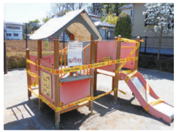
▲公園の遊具も使用禁止に

3月 4日 市立小・中学校、高等学校が臨時休業 公共施設の休館や飲食店の休業が相次ぐ