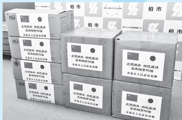
▲姉妹友好都市・承德市(中国)から届けられたマスク。箱には「共に困難を乗り越えよう」とのメッセージ