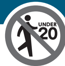
▲20歳未満のかたの立ち入りを禁止する標識例