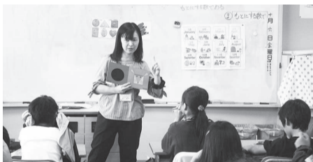
▲小学校での英語の絵本を使った授業の様子