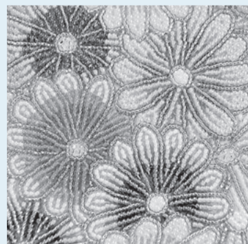
▲さまざまな色や形のビーズで作られています

大量生産できる今の時代だからこそ、人の手でしか作れないものを目指しているんだ。柏ビーズの商品を持つことで、お客様の個性を表現できたり、魅力を引き立てたりできたらうれしいな」