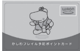
▲カシワニデザインのポイントカード