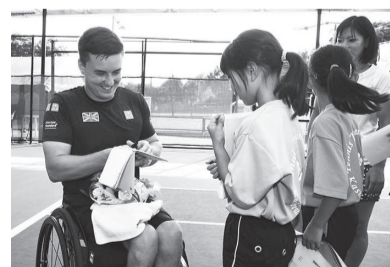
▲昨年の事前キャンプで市民と交流する選手