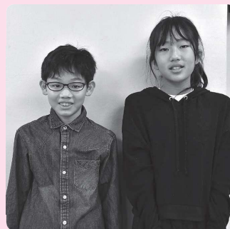
大津ヶ丘第一小学校6年生▶

この朗読劇をきっかけにこれからもいろいろなことを学び、戦争の怖さを私たちも次の世代に伝えていきたいです。