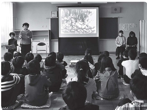
▲市内の小学校で、子どもたちに当時の小学生の描いた絵などを紹介しながら読み聞かせをしています

20年以上にわたり、市内で原爆の恐ろしさを語り継ぐ活動をしている「柏・麦わらぼうしの会」。戦争を実体験として語ることでできる人は高齢となり、年々少なくなっていく中、この会では戦争を体験したかたに話を聞いたり、実際に広島や長崎に行ったりしながら、手記や詩、絵などを集めています。そして、戦争を体験したかたの思いを受け継ぎ、決して当時の悲惨さを忘れてしまわぬよう朗読劇として、市内の小学校を回ったり、イベントに参加したりすることで、多くのかたに被爆者の手記や詩を伝えています。