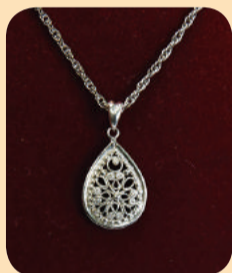
商品提供元 / VENROSE彫金工房