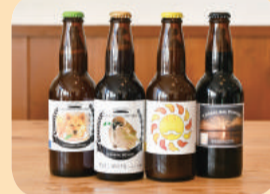
商品提供元 / こまいぬブルワリー