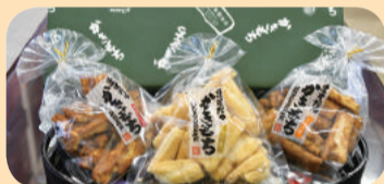
商品提供元 / アグリサポートシステム