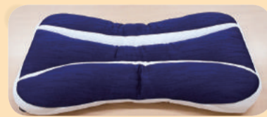
商品提供元 / まくら

I まくら(株)がつくった枕 ..... 3人 優しい肌触りと安定した寝心地が特徴の枕