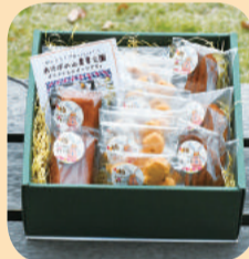
商品提供元 / あけぼの山パートナーズ