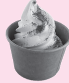
▲カブを使ったソフトクリーム