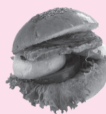
▲しょうなん野菜バーガー

市内の農産物を使用した「しょうなん野菜バーガー」などの軽食をはじめ、いちご・カブなどの道の駅オリジナルソフトクリームや地元野菜を使用したジェラートなど、ここでしか味わえないものばかりです。しょうなん野菜バーガーは時期によって使用する食材が変わるのも楽しみの一つ。お立ち寄りの際は、ぜひご賞味ください。