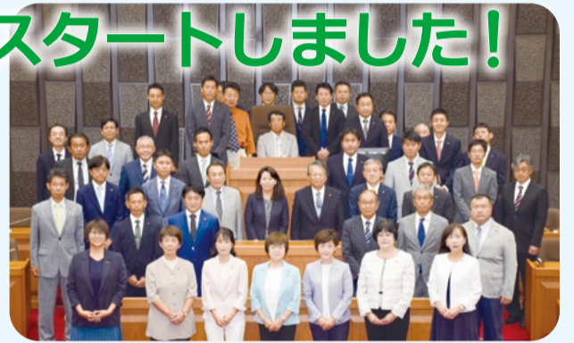
第19期柏市議会議員と市特別職

第19期柏市議会議員の任期が始まりました。任期は令和5年9月1日から令和9年8月31日までの4年間となります。年4回(3月、6月、9月、12月)開催される定例会では、議員から執行部に対して議案質疑や市政に対する一般質問を行っております。議場でしか味わえない臨場感があります。ぜひ傍聴にお越しください。