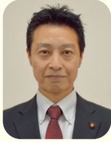
副議長 松本 寛道

市民の皆様には、日頃より、市議会に対し深い御理解と御協力を賜り、心より御礼申し上げます。このたび私たちは、9月議会におきまして議員各位の御推挙をいただき、議長並びに副議長に就任いたし、その使命と職責の重大さを痛感しております。