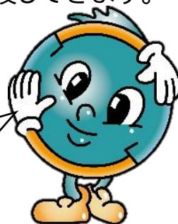
柏市ごみ減量マスコットキャラクター クリンちゃん