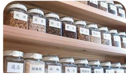
西洋医学だけでなく漢方による治療もご提案いたします

助産師による妊娠相談・育児相談・授乳相談・沐浴練習・思春期相談をしています。詳しくは当院ホームページをご覧ください。