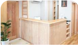
木の香りが漂うSDGsに配慮したやすらげるクリニックです