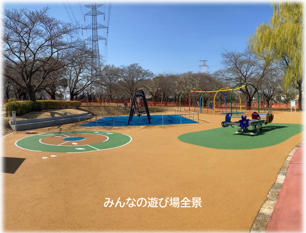
みんなの遊び場全景