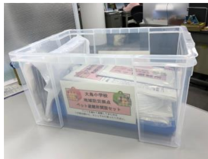
初動グッズのイメージ