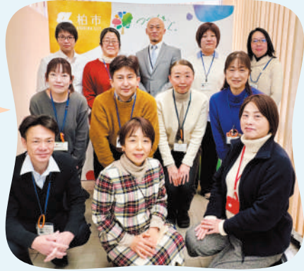
各地域の地域包括支援センターの皆さん