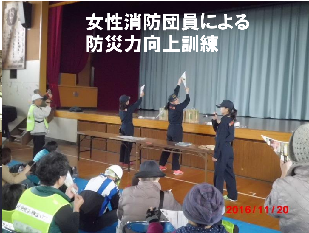
防災講話(柏市防災研究会)