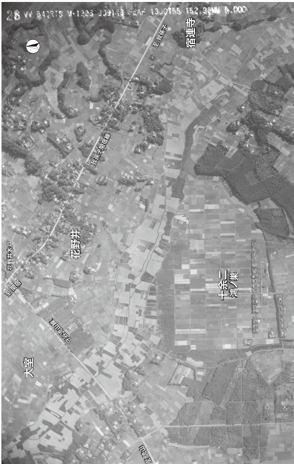
松葉町付近航空写真（昭和30年〈1955〉10月13日 米軍撮影 USA-M1226-28 国土地理院）に加筆