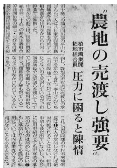
毎日新聞千葉版(昭和35年4月9日)