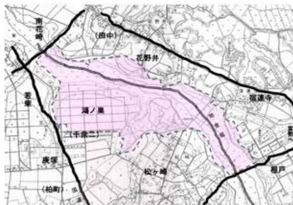
松葉町の範囲（櫻井良樹作図）

松葉町の位置 松葉町の範囲は、右上の図で点線で囲んだ薄いピンク色の範囲である（昭和31年の柏市全図に、現在の松葉町域を重ね合わせたものに、周辺の地名と、主要道路と水路を書き込んだもの）。地金堀（昔は小堀〈おっぼり〉と呼んでいたという）が国道6号から富勢へ向かう道路と交差するところ（伊藤ハムの工場のあたり）から、堀に沿って北方へ向かう谷の両側（柏公設市場前の交差点まで）と、この図で「鴻ノ巣」と示した丘陵の部分を加えたところである。