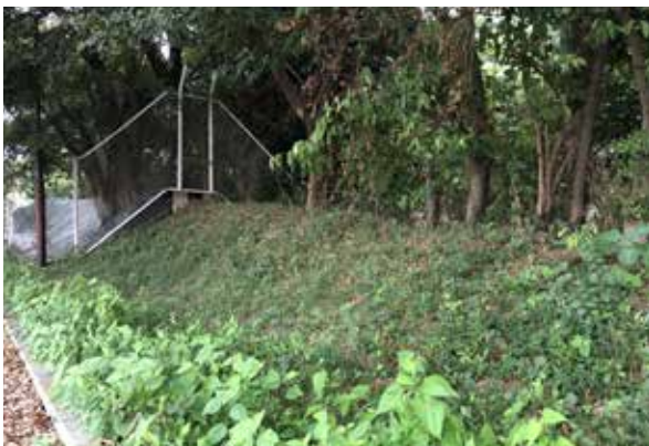
現存する野馬土手（令和7年）

平川 今話している場所に、「野馬土手（のまどて）」の跡があるんですね。なごみの米屋という菓子店の駐車場のところに少しだけ残っています。