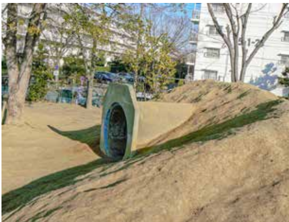
松葉1小に移設、再利用されたヒューム管 (平成22年1月)

浦久 話は変わりますが、松葉一小的「土山」に使われている土管 どかん について、昔の陸軍柏飛行場または跡地の開墾の際に設置されたものだと言ったことがあります、ご存知ですか。こんぶくろ池自然博物公園で保存公開されている秋水燃料庫 しゅうすい より、少し小型のヒューム管です。