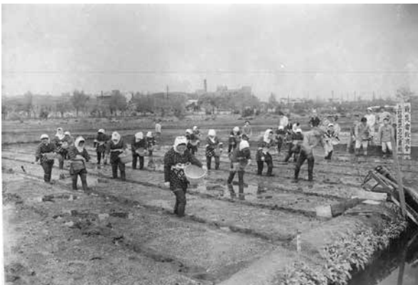
奉仕活動による田植えの様子(昭和22年)

田植えは280人の団員が半数ずつ、交代で行いました。もとは池だったためにビンのかけらなどがあり、怪我をした人もずいぶんいたと思います。怪我をしたら、地元の人が手配してくれて東大病院で治療してもらいました。