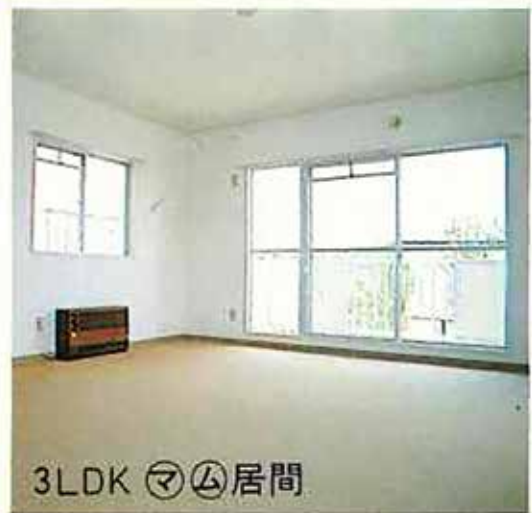
北柏ライフタウン内装