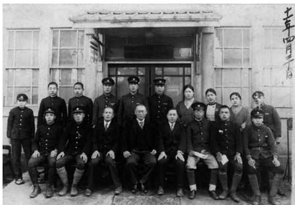
柏郵便局員の集合写真（昭和11年4月20日）

電話業務もありました。電話の交換もここでやっていて、当初交換台は1台で、加入者は60人ほどだったと思います。たしか1番が郵便局、2番が「㊤市場（まるなかいちば）」。女子は3~4人いて、保険と電話交換をやっていました。宿直では男子が交換業務にあたりましたが、電報もあるので2人以上の宿直が必要となり、しよっちゅうまわってきたものです。