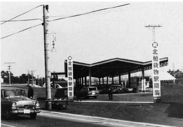
北柏駅貨物駅（昭和45年）