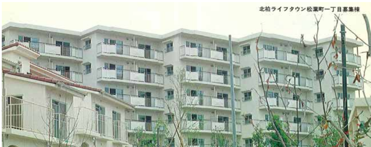
北柏ライフタウン松葉一丁目募集棟