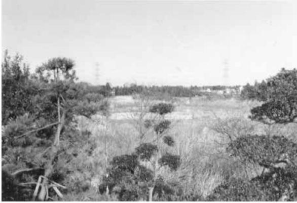
区画整理前の松葉町（昭和40年頃）

不動産の仕事がされていた。世間のことをよく知ってる人だから、住宅公団とも最終的には話がついて「じゃあ、ここを開発しようじゃないか」となったそうです。そういう話ができると土地を売る人や貸す人もいて、賛同を得られたんでしょう。