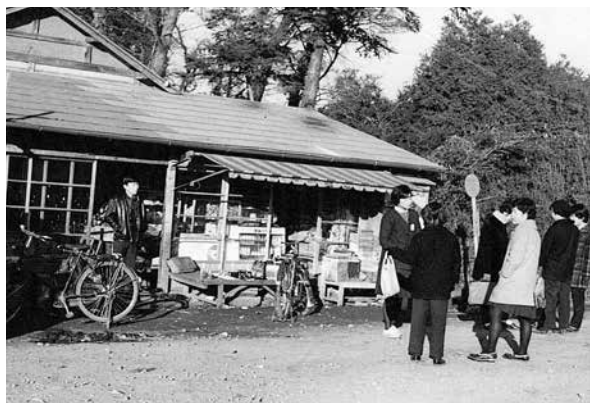
商店前のバス停（昭和期）

当時の道路の様子 松戸の女学校へは柏まで自転車で出て、鉄道を利用して通っていました。女学校に通う頃には（昭和13、4年頃か）、ずいぶん道も整備されたように思います。柏への道は途中から県道で、幅は約4メートル。あとの時代でいえば、バスがようやく通れるくらいです。冬は霜解けの泥がひどくて、泥をかき出すのに必要な篠竹を必ず持っていたくらいですが、それでも村道よりはずっと通りやすかったです。