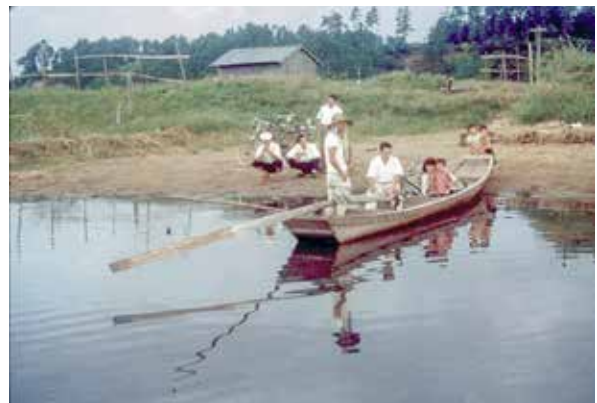
サッパ舟での渡し(昭和28年)

付近の集落(大井・五条谷・箕輪・岩井など)には、一つずつぐらいの渡しがありました。渡し舟はサッパ舟のような、5、6人が乗ればいっぱいになる簡単なもので、事故が多くありました。手賀沼は「魔の沼」と呼ばれていたくらいです。