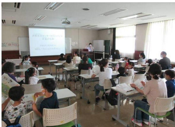
計量の仕事の講義