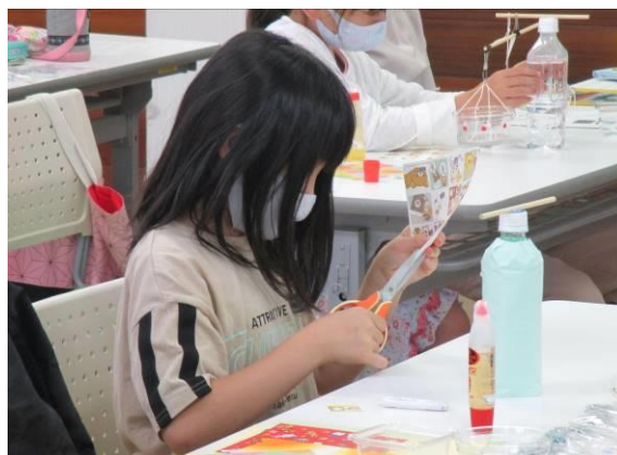
天びんはかりの工作