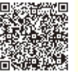
映像配信はこちら

A 市役所本庁舎6階の議会事務局までお越しください。傍聴カードに必要事項を記入していただいた後、職員が委員会室に御案内いたします。特に予約などは必要ありません。委員会の傍聴席は10人分あります。また、インターネット映像配信も行っておりますので、ぜひ御覧ください。