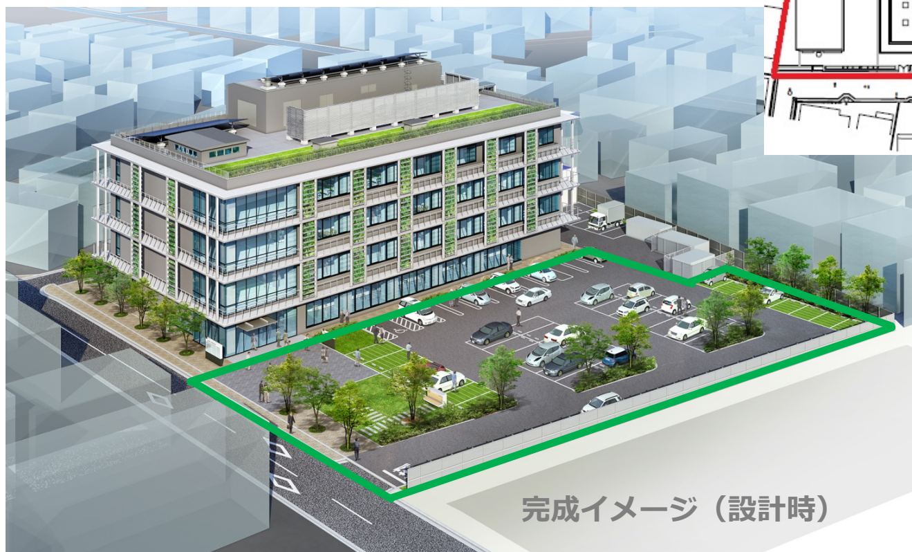
完成イメージ（設計時）