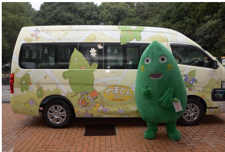
大和市コミュニティバス やまとんGO