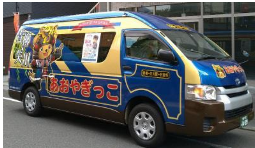
国立市コミュニティワゴン あおやぎっこ