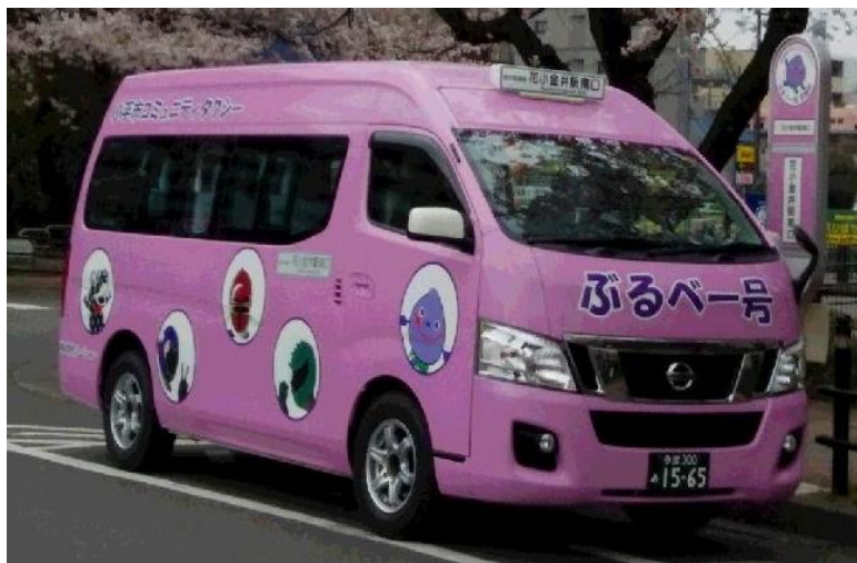
小平市コミュニティタクシー ぶるべー号