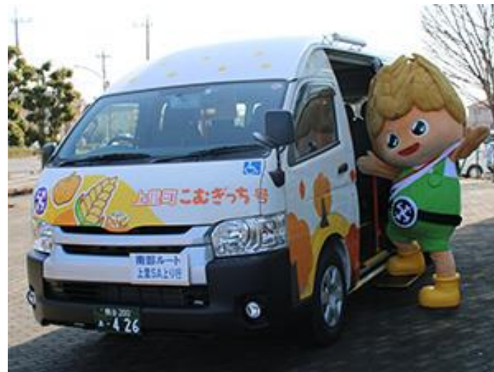
上里町コミュニティバス こむぎっち号