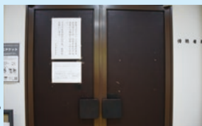
7階の傍聴者席入口

傍聴者席入口にて、体調の確認、手指の消毒やマスク着用の御協力といった、感染防止対策のお願いをしています。