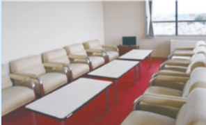
子供と一緒に本会議の生中継が視聴できる7階ロビー

本市議会では、お子様連れでも安心して傍聴できるように取り組んでいます。傍聴中に子供の声が気になり始めても、議場横のロビーにあるテレビで本会議の中継を御覧になれます。