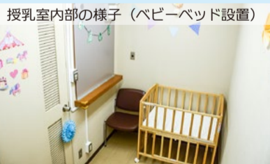
授乳室内の様子(ベビーベッド設置)