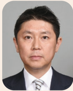
副議長 後藤浩一郎

市民の皆様には、日頃より市議会に対し、深い御理解と御協力を賜り、心より御礼申し上げます。このたび私たち両名は、9月議会におきまして、議員各位の御推挙をいただき、議長並びに副議長に就任いたしました。その使命と職責の重大さを痛感しております。