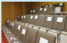
間引きしている傍聴席

新型コロナウイルス感染症対策のため、傍聴席に「着席不可」の貼り紙をし、間引きして御着席いただいています。