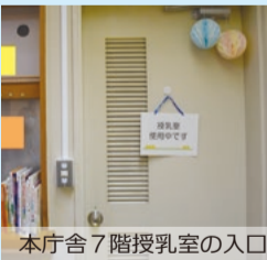
本庁舎7階授乳室の入口

赤ちゃんを連れて傍聴をされる方のため、授乳室を設けました。授乳室内では、授乳やおむつ替えができます。お気軽に御利用ください。なお、御利用の際は、本庁舎6階議会事務局へお声がけください。