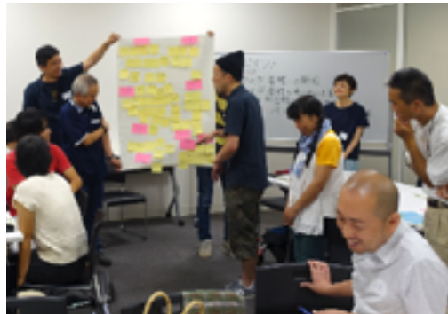
7月29日（日）パレット柏

積極的な意見交換から、毎回多くの気づきがあります。市のホームページには報告書を掲載していますのでぜひご覧ください。