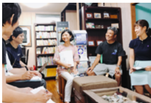
8月19日（日）手作り科学館Exedra