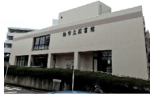
柏市立図書館 本館

また、柏らしい未来の図書館像を作り上げ、その先の運営につなげていくためには、市民の参画と対話のプロセスが不可欠であると考えます。そのため、次の流れで市民の皆さまと議論を深め、検討を進めていきます。たたき台として作成した案を柏市のホームページに掲載しています。ぜひご覧ください。