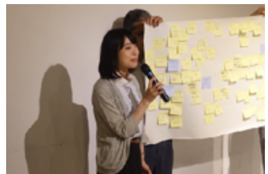
未来の柏の図書館について語り合おう！ @ノブレス・オブリージュ