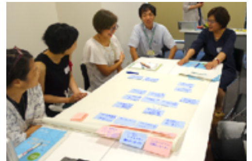
未来の柏の図書館について語り合おう！ @バレット柏