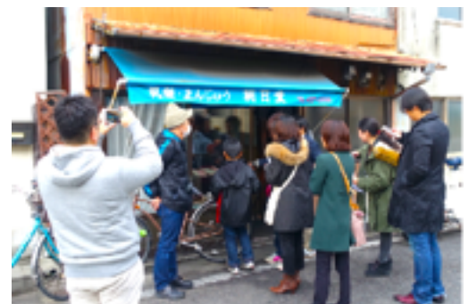
ワークショップでのまち歩きのイメージ