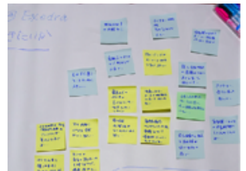
ワークショップで使用した模造紙と付箋