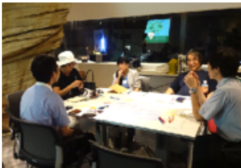
8月9日（木）ノブレス・オブリージュ（NOB）