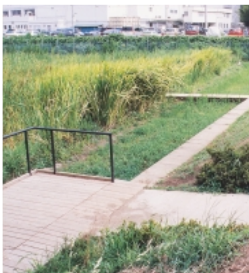
多くの生き物が生息できる水辺に