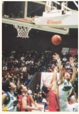
1月の皇后杯に続いてWリーグを制したジャパンエナジーJOMOサンフローズ