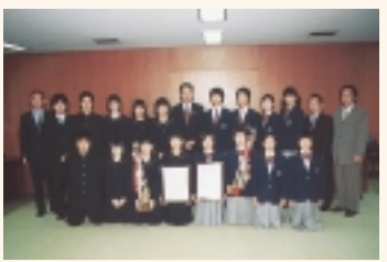
全日本吹奏楽コンクールで市立柏高が金賞、酒井根中が銀賞を受賞