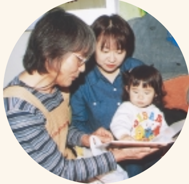
5月に始まったブックスタートでは本を通じて親子のふれあいを支援