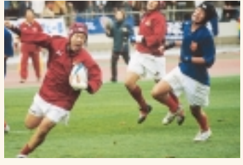
県大会8連覇と圧倒的な強さで花園行きを決めた流経大柏高ラグビー部