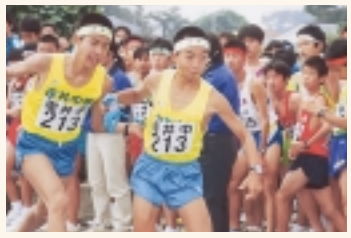
駅伝で東葛飾・県・関東大会を制した逆井中。全日本大会は23日。日本一目指し、ガンバレ!