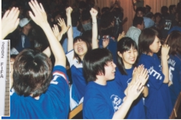
アミュゼ柏で行われたパブリックビューイング。日本代表の活躍に大興奮