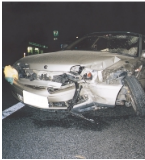
家族も一瞬のうちに不幸に...

「のびません しめす 重大事故につながります。ヘルトと 気のゆるみ」を 今年の重点目標は「飲 酒運転の追放」「シートベ ルトとチャイルドシート の全運動が12月31日(火)ま で行われています。 「少ししか飲んでいない から」「すぐそこまでだか ら」という 過信と油断が 県内の11月末現在の交通