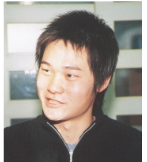
フェスピック大会車いすテニス金メダル くに えだ しんご 国枝 慎吾 さん