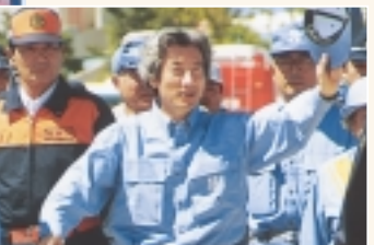
9月1日の七都縣市合同防災訓練では小泉首相も訓練に参加