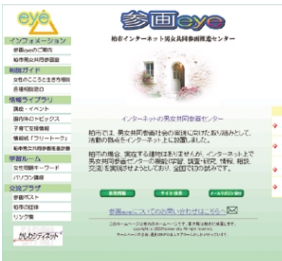
インターネットでいつでもアクセス