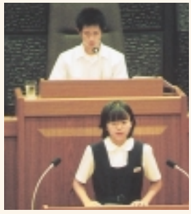
8月20日に行われた子供議会は実に33年ぶり