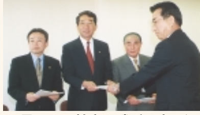
10月25日、柏市・我孫子市・沼南町まちづくり研究会から合併に関する研究報告書が提出