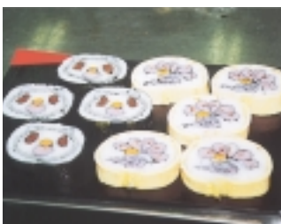
西原親子クラフトひろば

とき 8月25日(日) 午後1時半～3時半 ところ 西原近隣センター 対象 市内在住の小学生と保護者、各アーマ先着八組 テーマ 押し花クラフト、割りばし工作、ベニヤクラフト(四年生以上) 費用 一人三百円(材料費) 申し込み 当日、会場へ直接