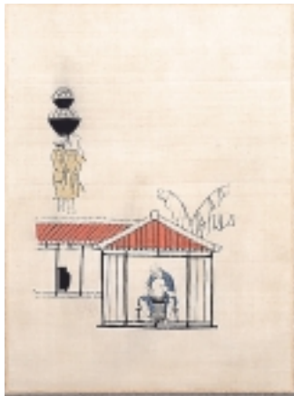
壺屋のくろくろ師と琉装の女

昭和14年に初めて沖縄に旅した後、制作した初期の代表的な作品。職人の仕事ぶりや荷を運ぶ町の女を染めている。