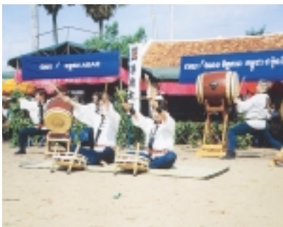
カンボジアでは、40度を超える暑さの中で演奏した

柏駅東口に新しい案内板ができました。案内板では市内の案内図のほか、イベントなどもお知らせします。サンサン広場に乱立していた公共看板も整理され、利用者からは、「駅前であって、スペースも大きいので、わかりやすい」という声。