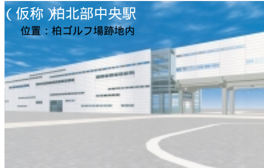
(仮称) 柏北部中央駅 位置：柏ゴルフ場跡地内