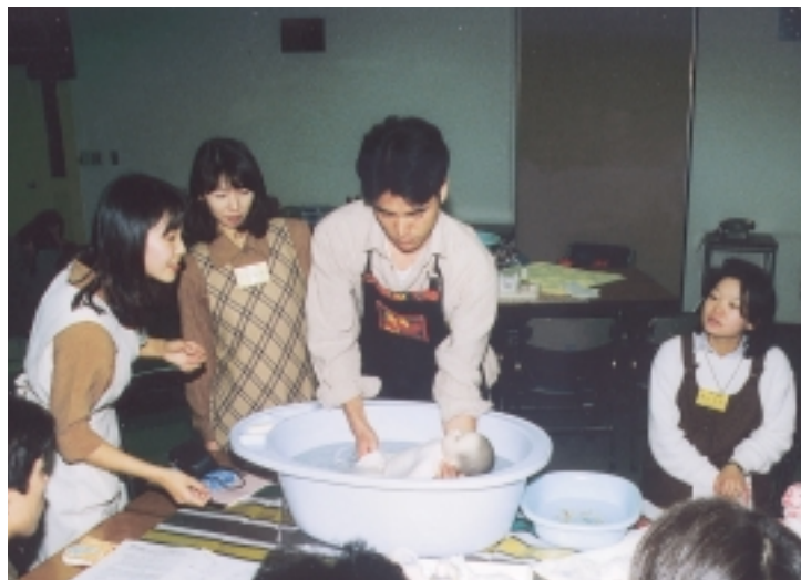
子育てもパパと一緒に大活躍(両親学級から)

相談日 毎週木曜日午前10時~正午と午後1時~4時 対象 市内在住・在勤・在学の女性のかた、各週先着5人 相談時間 1人につき40~50分程度 費用 無料 申し込み 相談を希望する日の前週木曜日の午前9時から、男女共同参画室(市役所第1庁舎3階)へ電話が直接