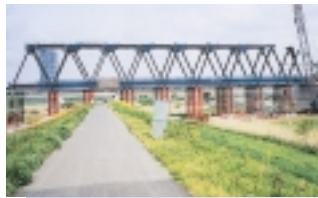
◀利根川を渡る鉄橋