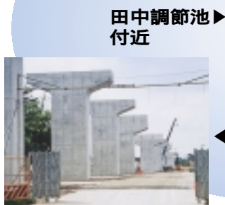
◀立ち並ぶ高架橋の橋脚(正連寺地区)