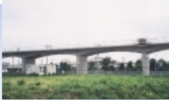
十余二・梅林地区