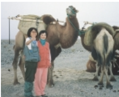
柏そごう8階連絡通路で5月20日まで写真展「ラクダと旅したシルクロード」を開催中