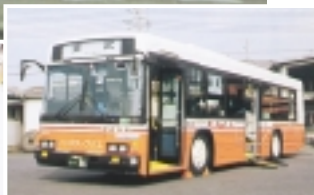
昇降口の床が低く、乗り降りが楽なノンステップバス