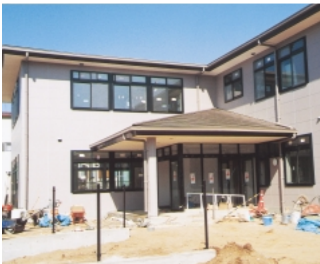
5月オープンに向けて建設中の「ほのぼのプラザますお」