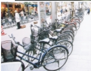
整列駐輪で少しでも歩道を広く