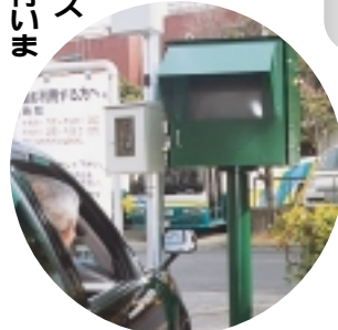
駅前の状況は待機所に設置されたモニターで確認

「パリアフリーワークショップ」は、昨年10月に続いて2回目の開催です。高齢者や障害者を含む市民と市職員が一緒に、