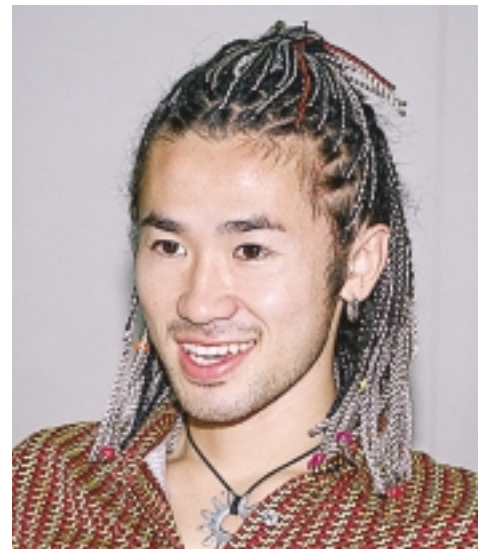
柏のストリートからメジャーデビュー