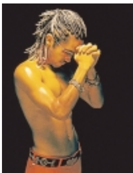
デビュー曲『Growing up!!』のCDジャケット

あけぼの山農業公園内の水田で、5月の田植え体験の参加者による稲刈り体験が、9月8日に行われました。慣れないかまを使い、男の子も女の子も一生懸命お手伝い。刈り取りが終わると、農家の皆さんが用意してくれた600個のおにぎりを、みんな口いっぱいほおぼっていました。刈ったお米は、1週間経ってから参加した皆さんの手に渡ります。