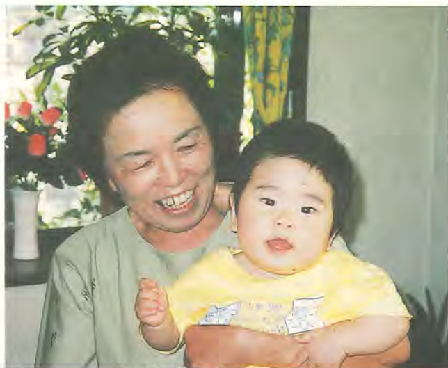
子育ては地域の人々で