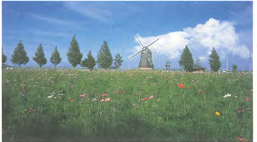
あけぼの山農業公園の花畑で、コスモスが咲きました。チューリップやヒマワリなど四季折々の花が楽しめるこの広場、今は抜けるような青空にコスモスが映え、さわやかな秋の風情が漂っています。花は今月下旬ぐらいまでが見ごろとなりそうです(写真は9月10日撮影)。