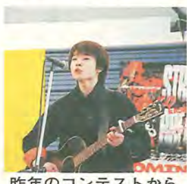
昨年のコンテストから