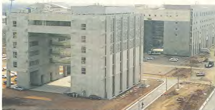
未来を開く研究が柏で行われます

今までの学問の枠を越えた新しい学問の形成を。柏キャンパスは、東京大学が目指す計画の一環として、平成7年から柏の葉に整備が進められてきました。本郷と駒場に次ぐ三つ目のキャンパスで、最終的には三十七ヘクタールの広い敷地に