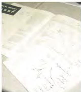
「今いちばん興味があるのは超伝導です」——物理の世界への興味は尽きない