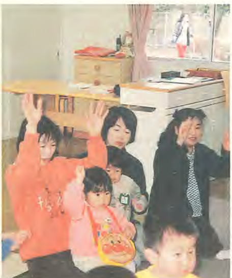
楽しみながら子育てを

とき・対象 5月～来年3月(夏休み・冬休みを除く)。 月曜日○歳児、火曜日○歳児、水曜日○歳児、木曜日○歳児、土曜日○歳児、日曜日○歳児。時間はいずれも午前9時半～11時半 ところ こあらルーム(酒井根保育園に電話) 費用 無料 申し込み 4月24日(月)までに、酒井根保育園に電話