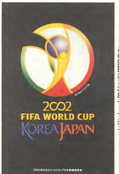
あの感動が日本にやって来る

の国との友好を深めるきっかけにもなります。また、柏を全世界にアピールする絶好の機会にもなります。