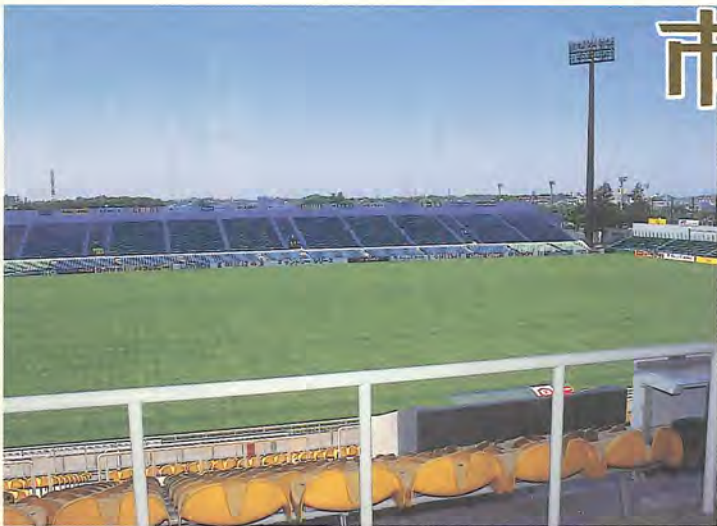
練習場になる日立柏サッカー場