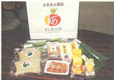
柏の顔が勢ぞろい

フランス大会での日本代表チームのキャンプ地であったエクストレランがそうであったように、滞在国にとって、柏がとて身近に感じられ、そ