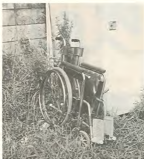
すぐにごみにしないで!

不要になった介護用品を必要なたたに無償で貸し出しするリサイクル事業を8月から始めました。はみんぐ・ほほえみ協同・四季の里の市内3つの在宅介護支援センターで貸し出しています。