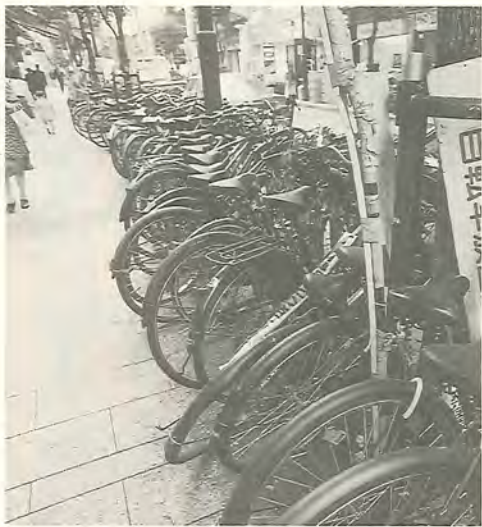
ちょっとだけでは済まされません!

辺に放置された自転車の撤去 を行っています。 昨年度は自転車の撤去に六 千二百万円のお金がかかりま した。放置自転車がなければ 使われることのない余計なお 金です。「自分一人くらい」と いう気持ちがこれだけの大き な無駄を生むのです。自転車 は市の駐輪場や買い物客用の 駐輪場など、正しい場所に置 きましょう。