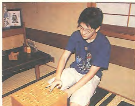
将棋盤を見つめる目は真剣

気温30度を超す酷暑の中、7月27日に行われた千葉県消防操法大会で、柏市消防団第4分団が小型ポンプの部で優良賞を獲得しました。会場の千葉県消防学校(千葉市)には、県内の市町村から選抜された11市町の消防団が結集。日ごろの訓練の成果を競い合いました。