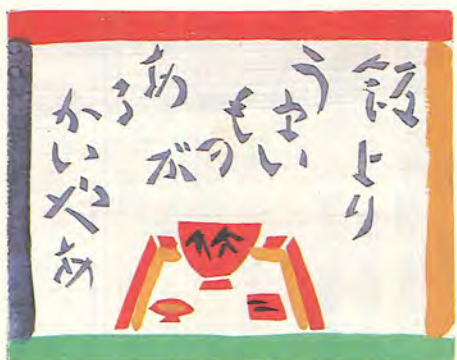
みょうこうにいんば げんぎ 妙好人因幡の源左・飯と餅