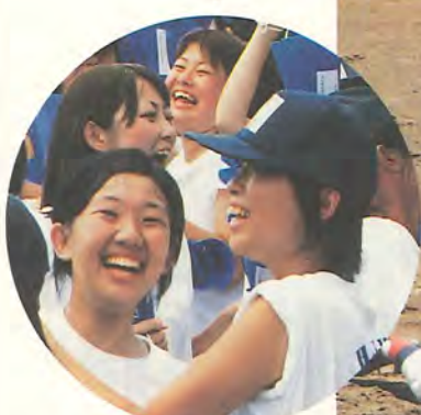
勝利に沸く応援団