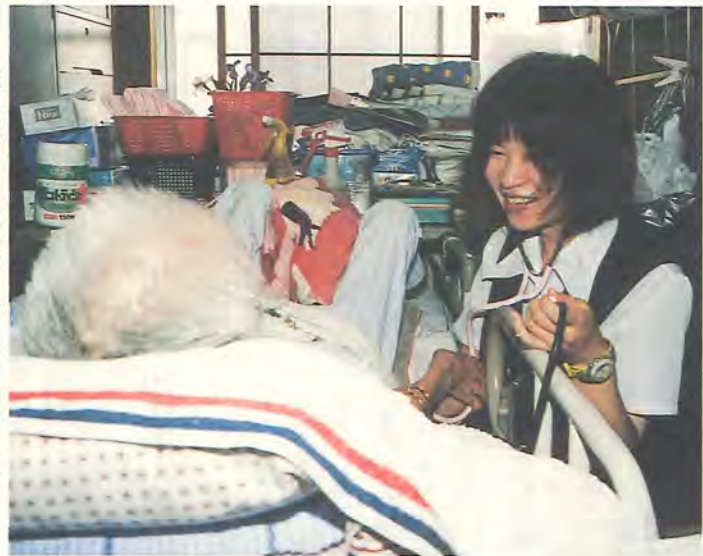
認定後、個別に介護サービス計画を作ります

「介護保険事業計画」は、委員には、保健・医療・福祉関係の有識者のほか、公募で選ばれた二人の市民のかたが加わっています。これまで六回の会議を開催