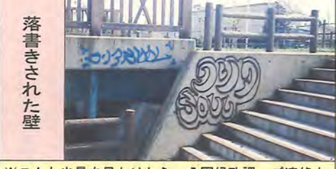
※こんな光景を見かけたら、公園緑政課へご連絡を