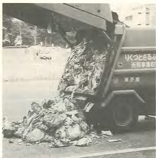
収集車1台分のごみで水切り実験