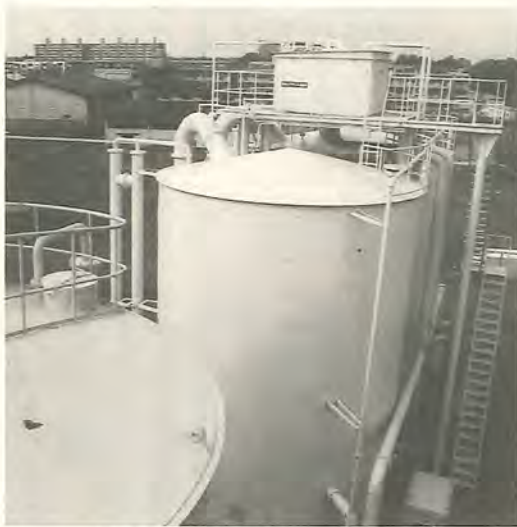
市民に水を提供する水源地

7月から9月は、年間でも水の需要が多い季節です。近年は、全国的に雨が少なく傾向が続いており、関東地方