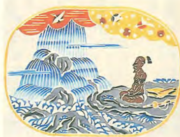
挿絵「新版絵本どんきぼうて」より