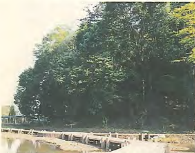
懐かしい風景に会いにいこう

また、水辺や林で生き物を観察したり、手作り体験場で米作りも体験できます。今後は、自然と触れられることのできるイベントを行うつもりで、市民のかたがたと管理・運営を行うなど、市と市民の皆さんが協力して緑地を守っていきます。 ※車での来園は遠慮ください(駐車場は7月20日ごろ完成する予定です) 園公園緑政課