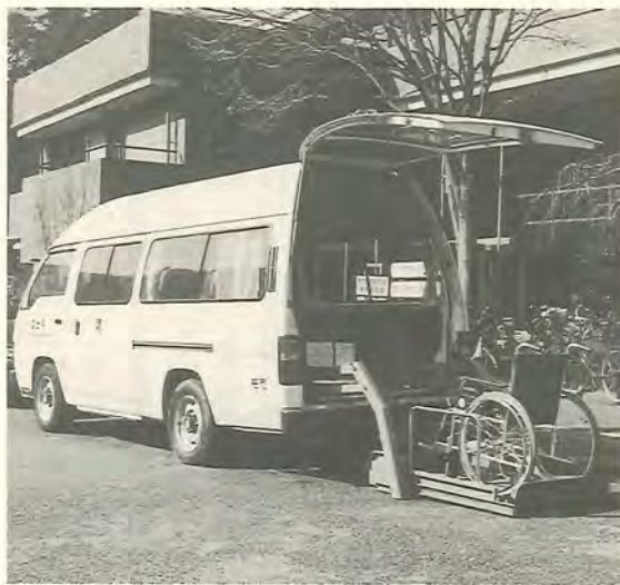
車いすを2台まで乗せられます

「外の空気を思い切り吸ってみたい」「自分で車を運転したい」と思っている障害者のかたは、柏市社会福祉協議会では、心身障害者やお年寄りに、車を貸し出します。