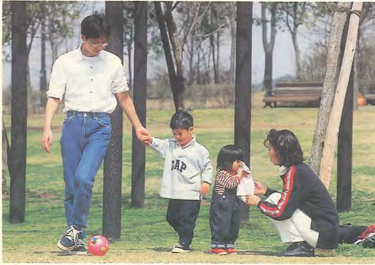
地域全体で子育て家庭を支えます

子どもが自由のびのびと遊ぶことができる時間や場所仲間が減っていることや、子育てと仕事との両立に悩み家庭が増えていることも問題と