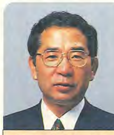
施政方針 柏市長 本多 晃

「ひと・まち・みどり」が光るふれあいの都市・柏の実現のため、第三次総合計画を着実に実行するとともに、行政改革をさらに進め、社会の変化に適応する行政体制の強化に努めます。