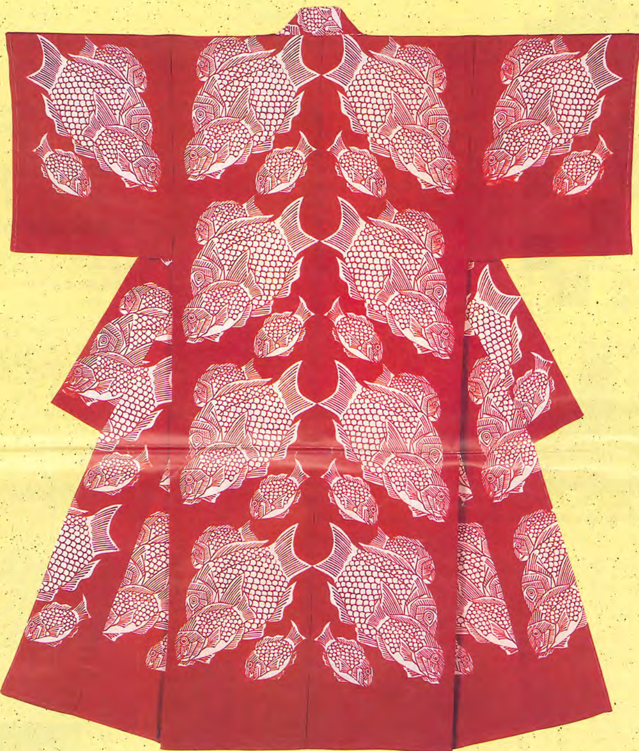
鯛泳ぐ文臙脂地縮緬着物(1964年)