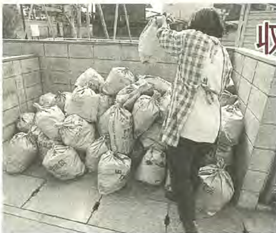
年末年始は収集日に気を付けて

年末年始はごみの収集日が通常とは一部異なります。ごみ出しカレンダーで確認して出すようにしてください。 12月31日(木)から1月3日(日)までは、ごみの収集業務がすべて休業となります。年末は大掃除などで、特にごみが多くなります。まとめて一度に出さずに、分けて早めに出すようご協力をお願いします。 ごみ出しは、収集日の当日、午前8時半までにお願ひします。