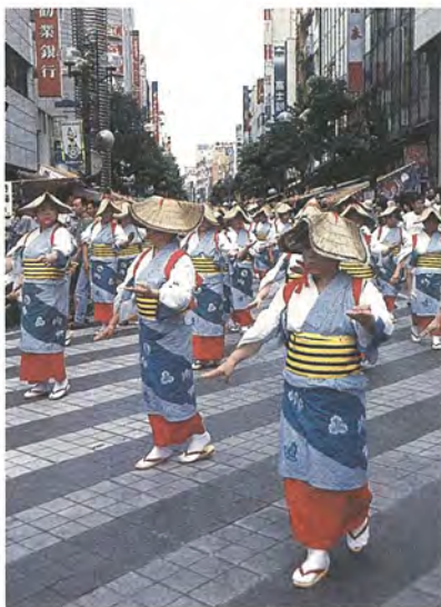
7月25・26日、柏市最大のイベント「柏まつり」に、60万人が集い盛大に行われました。