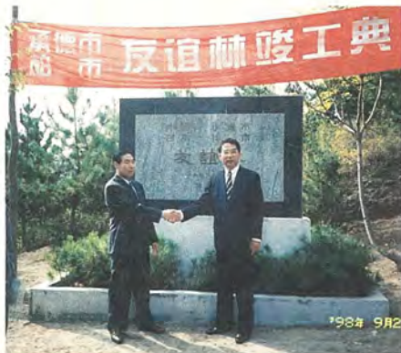
姉妹都市二十五周年を迎えたトランス市と友好都市十五周年を迎えた承德市へ、それぞれ柏から市長などが訪問し一層の友好を深めました。