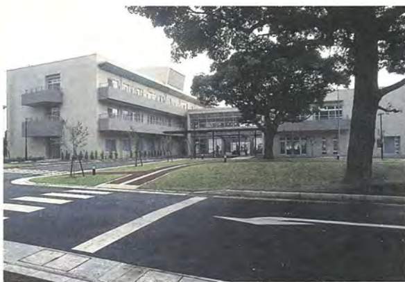
老人保健施設「はみんぐ」(写真・上)と、ふれあいと文化のスペース「アミュゼ柏」(写真・右)が、それぞれ完成しました。