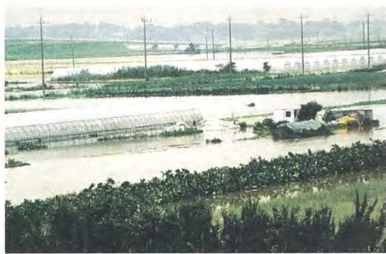
9月16日、台風5号の上陸により16年ぶりに利根の遊水池が冠水し、農作物に1億7千万円の被害がありました。