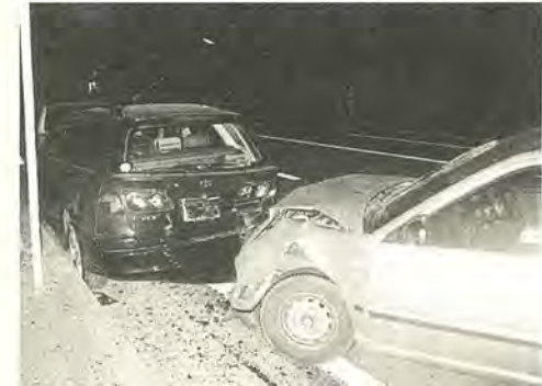
少しの油断が事故のもと

だけは大丈夫」などと高をくくらず、お酒を飲んだら絶対に車を運転しないようにしましょう。 お年寄りの事故が多発 柏警察署管内では、今年に入ってから死亡事故が多発しています。12月7日現在、死者が二十五人で県内ではワースト3位を記録しています。なかでもお年寄りの死亡事故が後を絶ちません。その多くは、普段通りなれた道路を自転車で通行中に発生しています。通りなれた道でも、お年寄りもドライバーも、安全