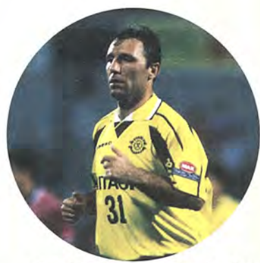
ブルガリア代表のストイチコフ選手が柏レイソルに入団。7月29日のヴィッセル神戸戦でデビューし大活躍しました。