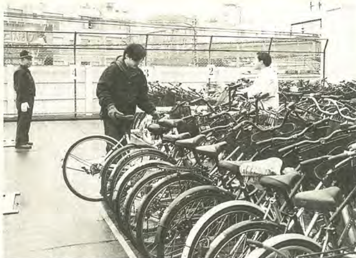
利用を希望するかたは申し込みをお忘れなく

を確認して通行するよう心がけましょう。事故はあらゆる所に潜んでいます。「あのとき、慎重に運転していれば……」。ほんの少しの油断でも取り返しのつかないことになりかねません。事故を起こした後に悔やんでも遅いのです。自分のために、そして大切な家族のために、ハンドルを握る時には、