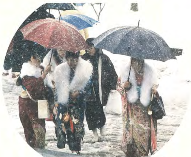
1月15日、大雪の中、成人式が行われ2,400人の新成人が参加しました。