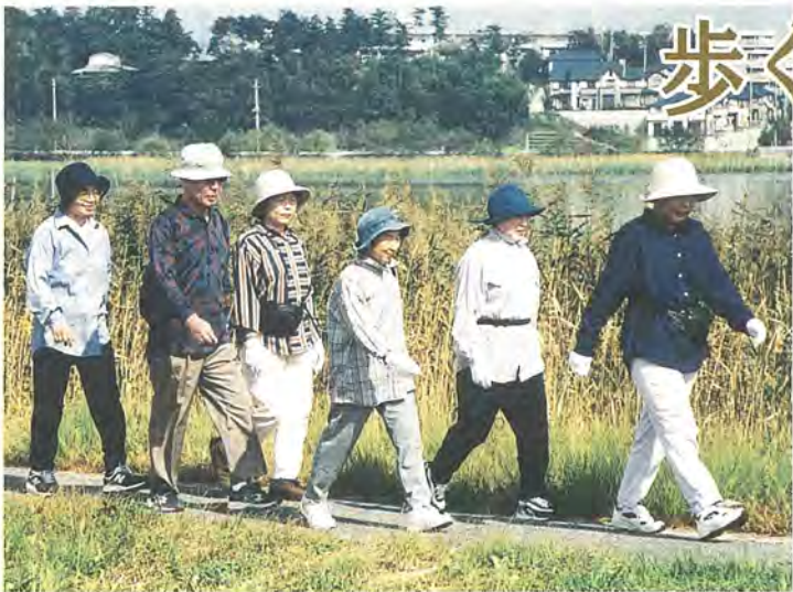
緑のなかを楽しくウォーキング