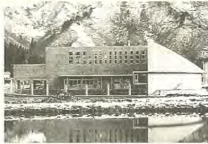
オープンを待つ博物館