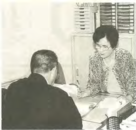
仕事探しのパートナーに

パートタイム就業・雇用のため、仕事を探しているかたが利用しやすくなりました。が、11月2日(月)に柏駅西口のエスパビル二階にオープンします。この施設は、これまで柏駅周辺に点在していた雇用についての相談窓口を、一カ所に集約することによ