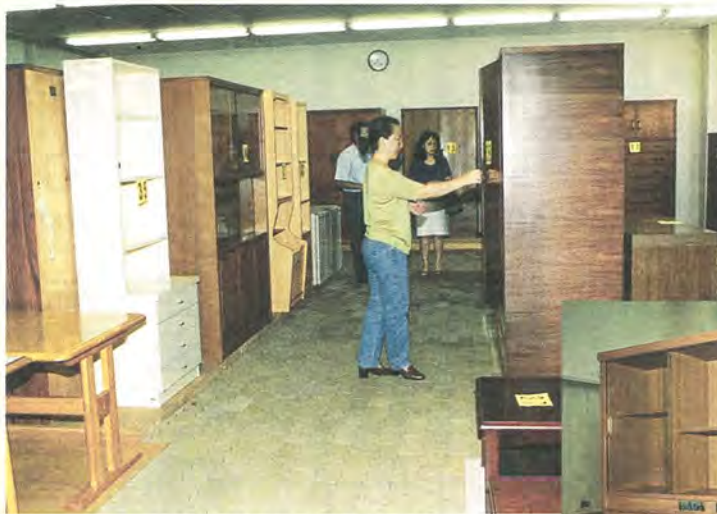
手入れの済んだものから公開します

引っ越しや家の建て替えなどで捨てられる、たくさんの家具。「まだ使えるのに…」というものもありますね。柏市では、粗大ごみとして出された家具の中からきれいなものを選んで、市民の皆さんに無料で提供しています。家具を売おうと思ったら、まず「リサイクル展示場」をのぞいてみませんか。