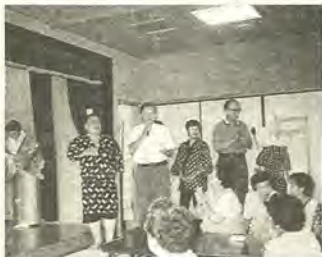
「楽しむ事が 続ける秘けつ」 平成8年2月にお年寄りのお宅への訪問ボランティアアサークルとして「ぼたんの会」は発足した。会員は四十代から七十代までの十人。

◇「楽しむ事が 続ける秘けつ」 平成8年2月にお年寄りのお宅への訪問ボランティアアサークルとして「ぼたんの会」は発足した。会員は四十代から七十代までの十人。