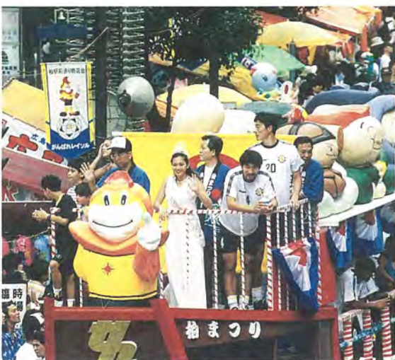
レイソル選手も参加した、毎年華やかな花自動車パレード