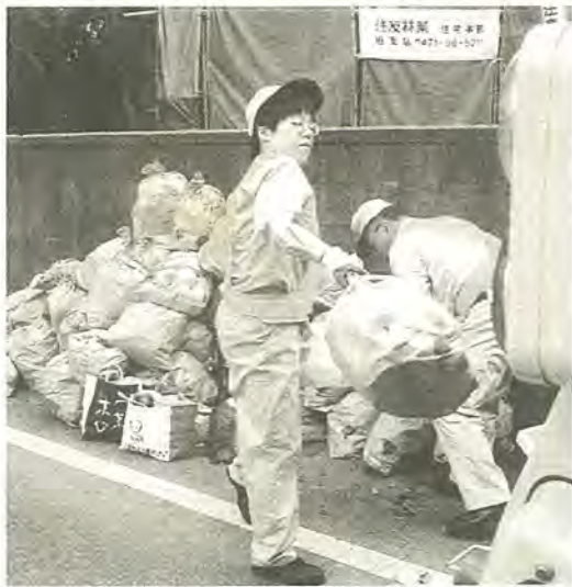
「思ったより大変…」。勢いをつけて、よいしょ!

夏は行楽シーズン。たくさんされるのでしょうか。人の思い出ができる一方、た 市では、市民の皆さんを対 皆さんのごみも出ます。その 象に、ごみ収集車の体験乗車 へは、ごみは一体、どのように処理 を行っています。実際の収集