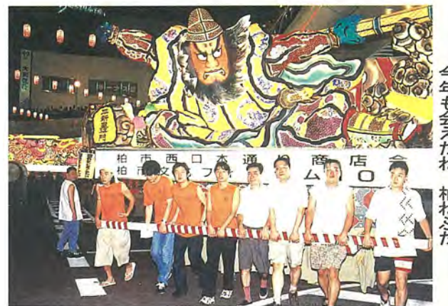
今年も会えたね、柏ねぶた