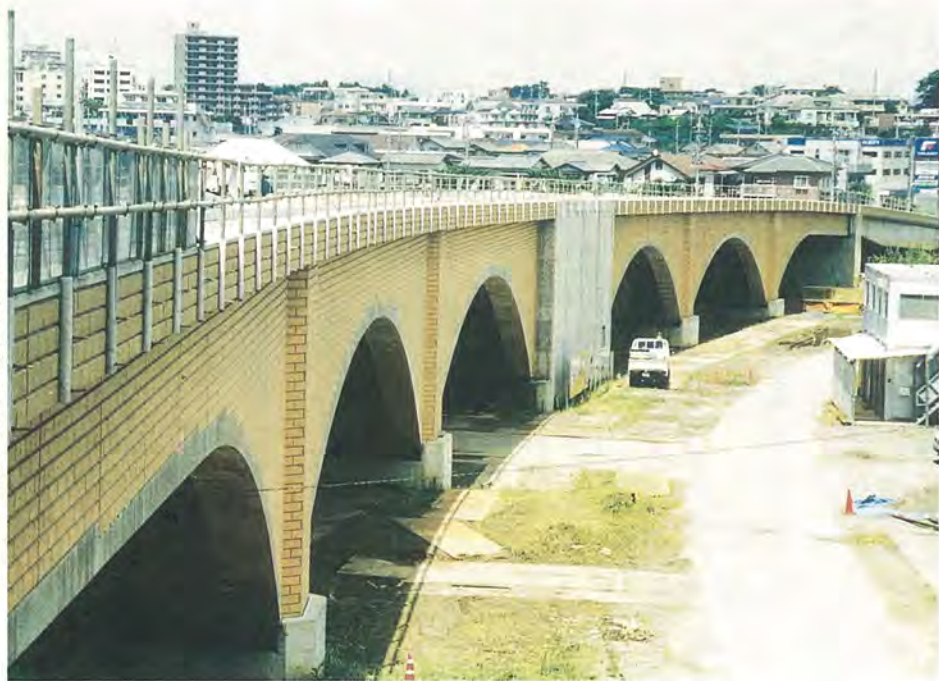
新たな柏市のシンボルになります