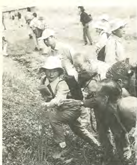
自然にじかに触れるチャンスです

今回募集するかたのほかに、 現在五十一人のかたが調査員 として、市内各地域で活動し ています。今まで行われた調 査では、増尾にホタルが生息 していることや、南部地域に 貴重種であるコクランが自生 していることがわかりまし た。動物ではイタチの仲間 のハクビシンがいたという報 告もあります。