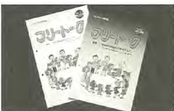
自由な意見交換を

また、市でも「男女の共同 参画をめざす柏プラン」を作 り、各種事業に取り組んでい ます。昨年には柏プランを共 同推進するため、市民のかた がたに参加を呼びかけ、男女 共同参画推進ネットワーク(ト ライネット)を組織し、学習 会や交流会を行っています。 みんなでつくる情報紙