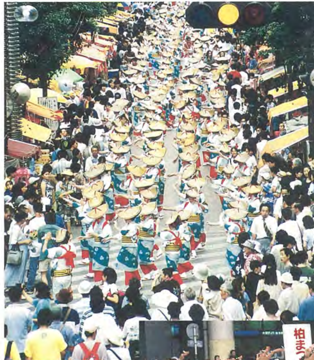
柏まつりのメインイベント、柏おどりのパレードとコンテスト

7月25日(土)・26日(日)の両日、本格的な夏を告げる「柏まつり」に延べ六十万人が集まりました。初日は、あいにく雨が降ったりやんだりでしたが、二日目は開始前までのにわか雨がすっかりあがり、威勢の良いかけ声が柏駅周辺に響きわたって、まつりを一層盛り上げていました。 今年も三百人の柏おどりの大パレードとコンテスト、今回は一基増えて三基になったねぶた、花自動車パレード、ステージイベントなど柏市最大のイベントが盛大に行われました。