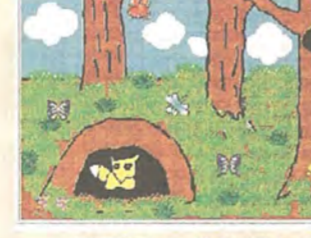
物語をより身近に感じる「案内板」

4時間目 2年1組 生活科 「大きくなったわたし」 「自分の名前、生年月日、身長、体重、髪の色、目の色、好きな食べ物、得意な科目、将来の夢など、自分の成長の様子を写真やイラストで表現し、それをパソコンでまとめたアルバムを作りました。」 4時間目 「大きくなったわたし」 「自分の名前、生年月日、身長、体重、髪の色、目の色、好きな食べ物、得意な科目、将来の夢など、自分の成長の様子を写真やイラストで表現し、それをパソコンでまとめたアルバムを作りました。」