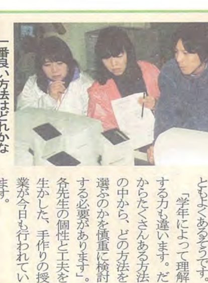
一番良い方法はどれかな

職員室 先生たちも奮闘中！ 「この学校は、市の中心部から離れたので、図書館なども遠いです。授業にコンピュータを使うために、インターネットを通じて情報を取り出せれば、先生たちは大変です。たまたま、この学校で、先生たちは大変です。たまたま、この学校で、先生たちは大変です。たまたま、この学校で、先生たちは大変です。」 職員室 先生たちも奮闘中！ 「この学校は、市の中心部から離れたので、図書館なども遠いです。授業にコンピュータを使うために、インターネットを通じて情報を取り出せれば、先生たちは大変です。たまたま、この学校で、先生たちは大変です。たまたま、この学校で、先生たちは大変です。」