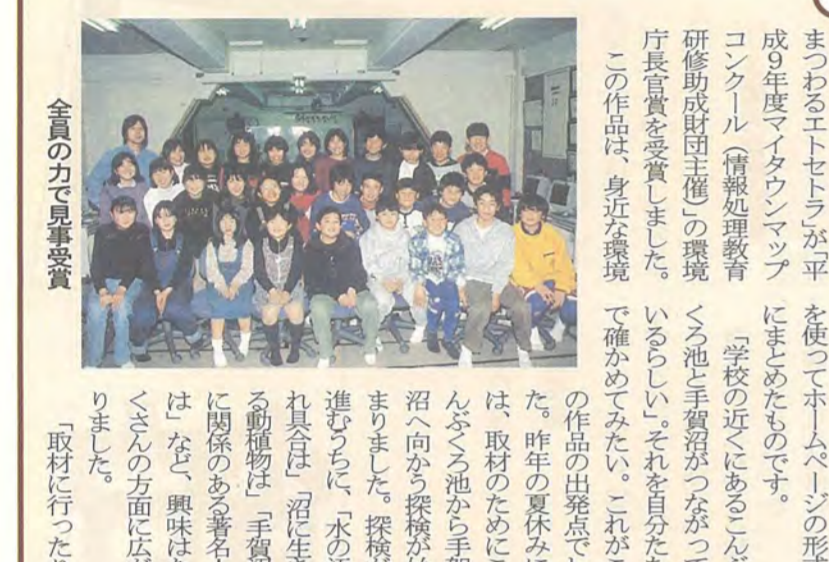
全員の力で見事受賞