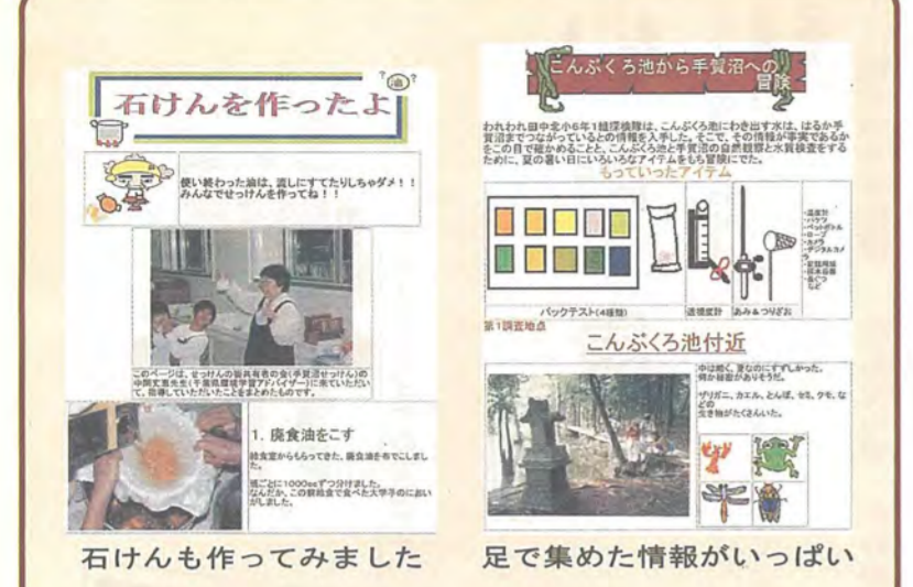
石けんを作ったよ