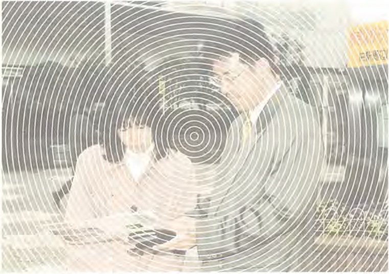
「うまい話」には、き然とした態度で

口上が巧みで、手口も多様化しているため、知らない間に契約を結んでしまっていたという場合が多いようです。「将来の投資」を売り言葉に、高価な宝石や絵画を売り付けられたり、「会費を払えば、長期間いつでも使えます」と、