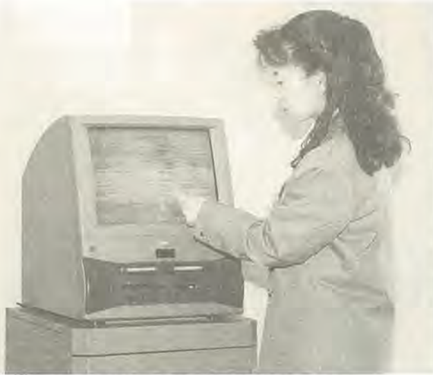
知りたい情報を簡単に検索できます

「ボランティアやサークル」市民活動情報提供システムが3月16日(月)からスタートする。このシステムは、市役所のロビーにパソコンを設置し、このパソコンで市内で活動するボランティアやサークルの活動内容や費用募集要項などを簡単に検索できるようにしたものです。画面にタッチして操作するタッチパネルなので、パソコンが苦手な方でも簡単に利用いただけます。現在、八百三十九の団体が登録され、活動内容・活動地域ごとに分類されています。一覧になりたいものがすぐに見付かります。このシステムに新規の登録を希望された方や登録内容の更新を希望された方は、市民生活課で随時受け付けていますので、お問い合わせください。