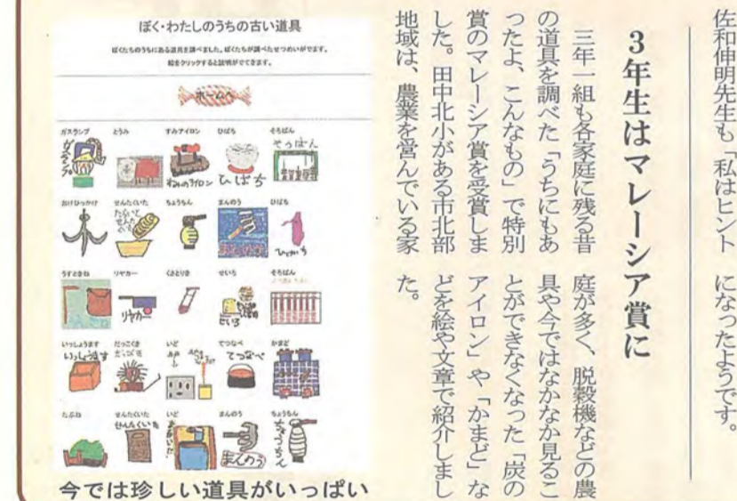
ほくわたしのうちの古い道具