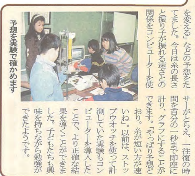
予想を裏切ります

5時間目 5年1組 理科 「おもりの動きとはたらき」 振り子が振れる速さを、振り子の長さを変えてみる。おもりの重さを変えてみる。おもりの大きさを変えてみる。振り子の動きをセンサーで測り、グラフにすることができました。振り子の動きと振り子が振れる速さとの関係をコンピュータで調べました。 5時間目 「おもりの動きとはたらき」 振り子が振れる速さを、振り子の長さを変えてみる。おもりの重さを変えてみる。おもりの大きさを変えてみる。振り子の動きをセンサーで測り、グラフにすることができました。振り子の動きと振り子が振れる速さとの関係をコンピュータで調べました。