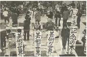
周年事業で日ごろの成果を発表

15日の雪は水分をたくさん含んだ重い雪だったせいも、救急車の出動や市の施設の損傷、ビニールハウスの被害なども8日の降雪の際よりも多くなりました。 ところで、この三回の降雪に際しては、融雪剤の塩化カリウムをまいたり、ローターを動かしたりするのには費用は千五百万円余り。職員の夜間待機や除雪道具の購入費などを含めると、合わせて二千万円前後の臨時の出費でしょう。 しかし、大雪に見舞われた割には重大な事故、大混乱がなかったのは、正確な天気予報と市民の皆さんの早めの準備のおかげです。緊急のときに何が大切か、意外にも大雪が私たちに教えることになりました。