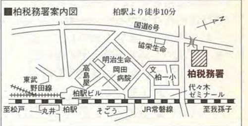
■表2 医療費控除の要件と必要書類