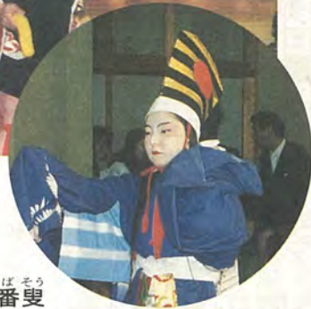
さんばそう 三番叟

「歩射(ぶしや)」と呼ばれる矢を射って、その年の豊凶を占ったと伝えられている「船戸のおびしや」。元和時代(1620年ごろ)から始まったとされています。今年も1月18日に、船戸会館で行われました。「おびしや」の見物は、この地域に住むかたにとって、新年の恒例行事。この日も大勢の人が集まり、やんやのかっさいを送っていました。