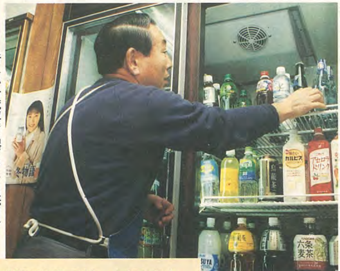
新しい冷蔵庫で品ぞろえも豊富に