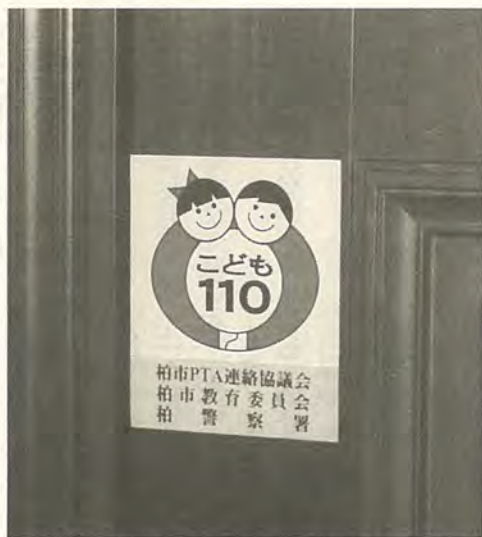
防犯効果も期待される"こども110"

通り魔や変質者による殺傷事件、誘拐事件など、子どもを狙った犯罪がここ数年増えてきています。こうした犯罪から子どもを守るため、柏市PTA連絡協議会では、市内全域の通学路に「こども110」という緊急避難所を設置しています。 「こども110」は、市内の商店や一般の家庭に協力をお願いして、いざというときの子どもを避難所にするものです。避難所となるかた また、「こども110」は、緊急避難所として役立つだけでなく、避難できる場所を明確にしておくことで、地域で子どもを守っていくという姿勢を示すことにもなり、防犯効果も期待されます。 ステッカーは、昨年12月にPTA連絡協議会から市内の小・中学校のPTAに配布されました。現在、各PTAでは児童・生徒の家族をはじめ、町会にも協力をお願いしているところです。協力いただける商店や家庭から順次スタートしています。 緊急避難所に協力されるかたは、最寄りの小・中学校にご連絡ください。未来を担