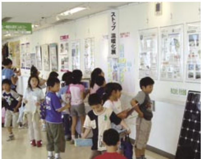
5・6月に行われた温暖化展