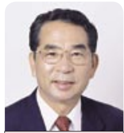
市長 本多 晃

◆中核市への移行 9月定例会で千葉県県知事の同意を得、10月に総務大臣に中核市指定の申し出を行いました。その後閣議決定、11月21日に政令が公布されたため、来年4月の中核市移行が正式に決定しました。関係条例の制定等