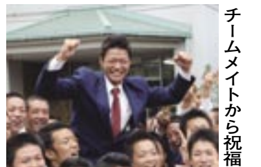
チームメイトから祝福

市の人口 (19.11.1 現在) 388,579人 (前月比229人増) 男 193,496人 女 195,083人 151,007世帯 (前月比225世帯増)