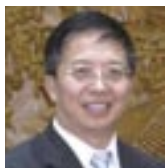
東洋学園大学・朱建榮教授

とき12月15日(土)午後6時～8時 ところ中央公民館 定員先着150人 費用300円 申し込み柏市国際交流協会へ電話で※12月11日(火)まで