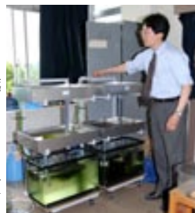
飼育装置。カワニナとホタルを同時に飼える

増尾台在住。45歳。6月1日(金)・8日(金)午後7時～8時半に県立沼南高校でホタル観賞会を行う(雨天中止)。〒県立沼南高校 ☎7191-8121